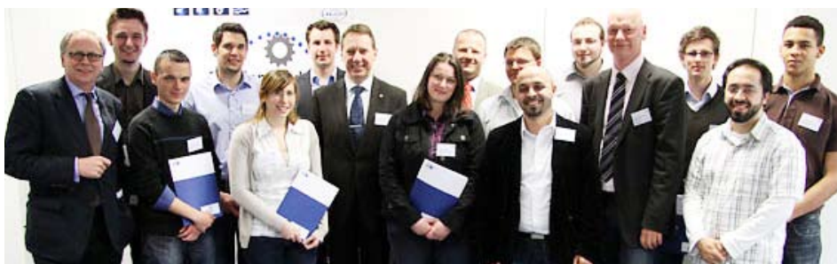
Die Stipendiaten der zweiten Studienfonds-Runde erhielten ihre Förderurkunden.