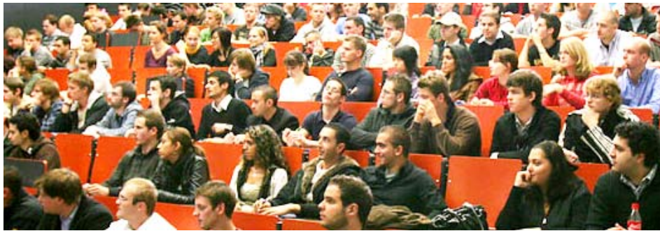
Der Campus Gummersbach der FH Köln verzeichnet einen Boom bei den Anmeldungen.

Mit rund 180 neuen Studierenden im Ingenieurwesen meldet der Campus Gummersbach der Fachhochschule Köln für das Sommersemester Rekordzahlen: Es ist die höchste Zahl seit Einführung der zwei Einschreibetermine - zum Sommersemester und zum Wintersemester - im Jahr 2001. Im Durchschnitt der vergangenen Jahre gab es bei den Ingenieurwissenschaften maximal 150 „Ersties“ zum Sommersemester.