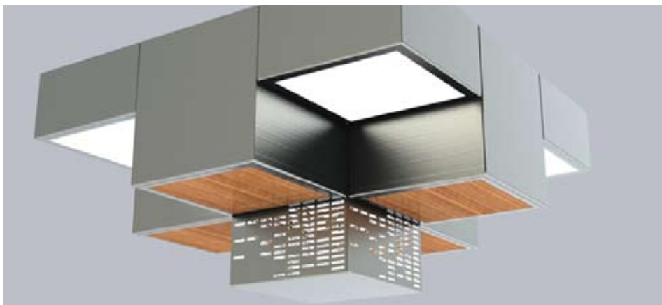
Mit „Cube“ kann das Unternehmen künftig auf spezielle Kundwünsche eingehen.

Der Auftraggeber mit seinen 120 Mitarbeitern ist spezialisiert auf individuelle Lösungen in Zusammenarbeit mit Architekten und hat bundesweit einen guten Namen für hochwertige und energiesparende Lösungen in Museen oder Verkaufshallen, arbeitet aber auch für die Automobilindustrie. (www.lenneper.de). Die Studierendengruppe wählte gemeinsam mit den Mitarbeitern von „Lenneper“ aus ursprünglich zwölf Ideen drei aus, die in neue Modelle mündeten: Edge, Lamella und Cube. Edge ist ein Leuchtensystem, das sich in seiner Vielsei-